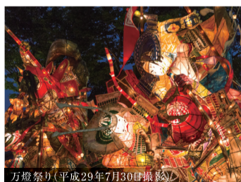
万燈祭り(平成29年7月30日撮影)