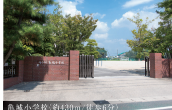
亀城小学校(約430m*徒歩6分)