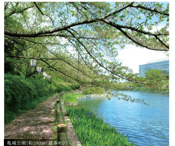
亀城公園(約590m*徒歩8分)

由緒ある史跡が点在する「歴史の小道」や「万燈祭」などの伝統文化が暮らしの一部になる「刈谷銀座」。駅徒歩5分の便利さや市内No.1タワーの誇りと合わせ、「歴史と未来」が交わる中心地の暮らしやすさを実感できます。